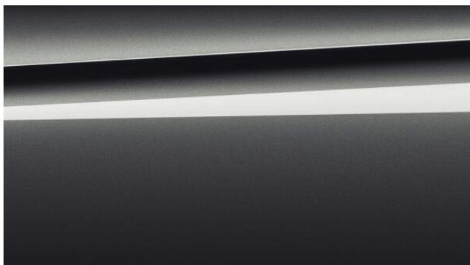
BMW Individual metalický lak Dravit C36