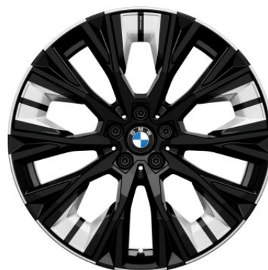
20" BMW Individual aerodynamická kola 3FX