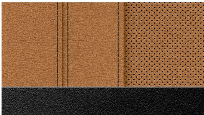
Umělá perforovaná kůže Sensatec Cognac s KHKC